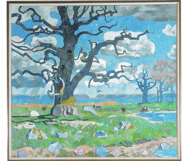
Skejten. Maleri af Olaf Rude. Hænger på Folketingets bagvæg.