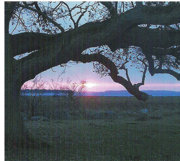
Skejten ved solopgang.

I skovbrynet findes to udsigts- og spisepladser med fin udsigt til markerne mod Skejten.