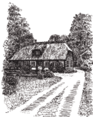
Hus ved Skibdehage